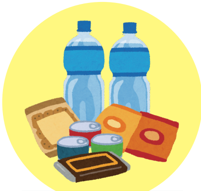
困窮学生への食支援