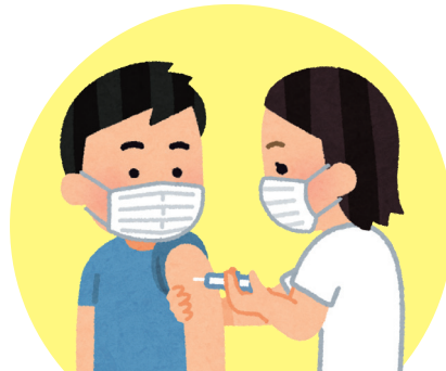
大学施設での職域による ワクチンの集団接種