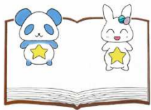
学生考案の マスコットキャラクター 「ビブとリオ」