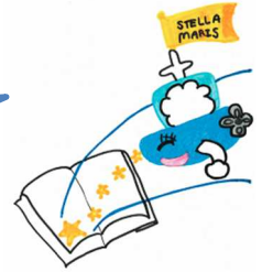
学生考案の マスコットキャラクター 「マリーちゃん」

私は「マリーちゃん」、 「ビブとリオ」と共に レポートや卒業研究に必要な図書や文献を 探す方法をお伝えしますね！！